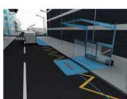
Arrêt de bus (2 vis-à-vis - en chaussée démontable)