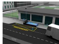
Aire de livraison (15x2,60 m) mutualisée avec arrêt de bus