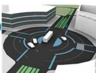
Site propre du futur