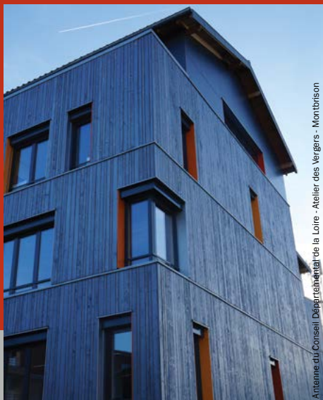
Antenne du Conseil Départemental de la Loire - Atelier des Vergers - Montbrison